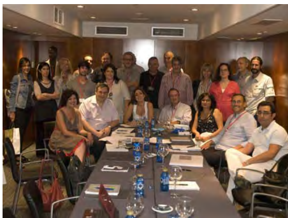
Lám. 2. Grupo de trabajo sobre la candidatura de los Dólmenes de Antequera a Patrimonio Mundial durante el seminario Megalithic Sites and the World Heritage Convention.

El documento final incluyó las opiniones y recomendaciones vertidas en las distintas mesas de debate y fue presentado y aprobado el 25 de octubre de 2011 por el Consejo de Patrimonio Histórico Español reunido en el Monasterio de El Paular (Madrid). Este consejo es el órgano de coordinación entre la Administración del Estado y de las