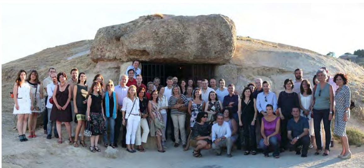
Lám. 3. Visita de los miembros del Consejo de Patrimonio Histórico Español a los Dólmenes de Antequera.