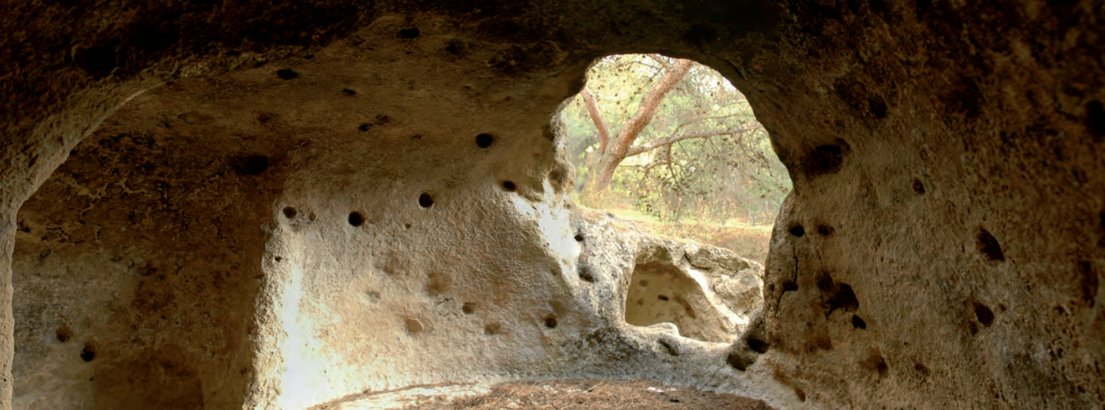
Vista desde el interior de la estructura nº 2 de la necrópolis en cuevas artificiales del cerro de Las Aguilillas (Campillos, Málaga).